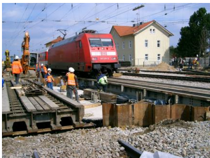
Bau einer Eisenbahnüberführung

Durch die Baumaßnahme soll die zulässige Höchstgeschwindigkeit für die Fernbahn von 160 km/h auf 190 km/h erhöht werden.